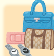
【ブランド品・時計】