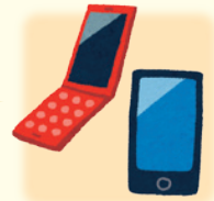
【携帯電話・スマホ】