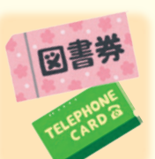
【図書券・テレカ・金券】