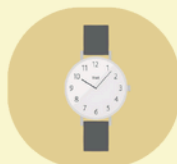
ブランド品・時計