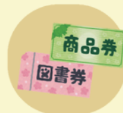
図書券・テレカ・金券