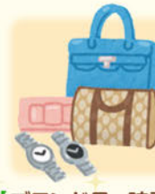
【ブランド品・時計】