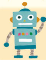
【懐かしのおもちゃ プリキ玩具】