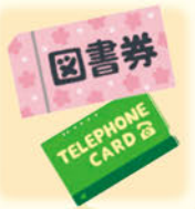
【図書券・テレカ・金券】